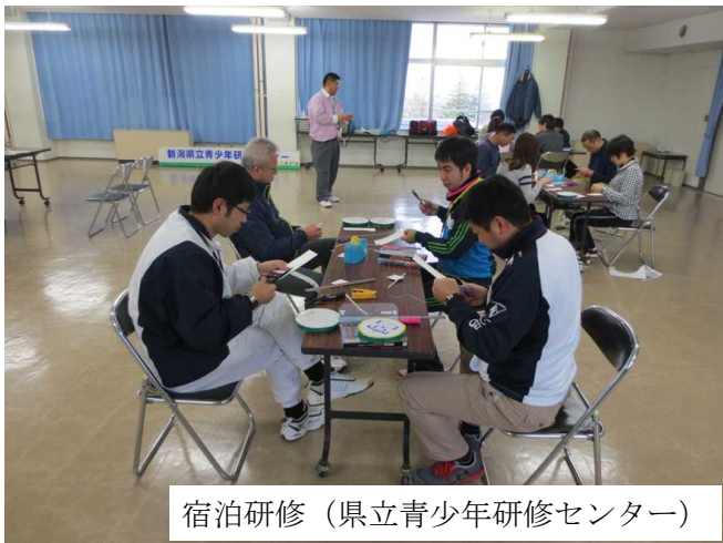
宿泊研修（県立青少年研修センター）

平成25年度社会教育主事講習 [B] が1月22日(水)から2月28日(金)まで38日間にわたり実施されました。