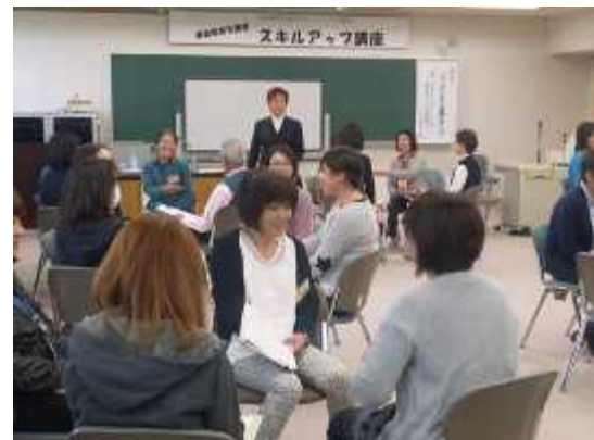
【第3回コーチングで支援力アップ（新潟会場）】

ガイドブックの活用を目指し、講座の流し方や留意点等について学んだ後、各グループで場面設定をして講座作りをしました。