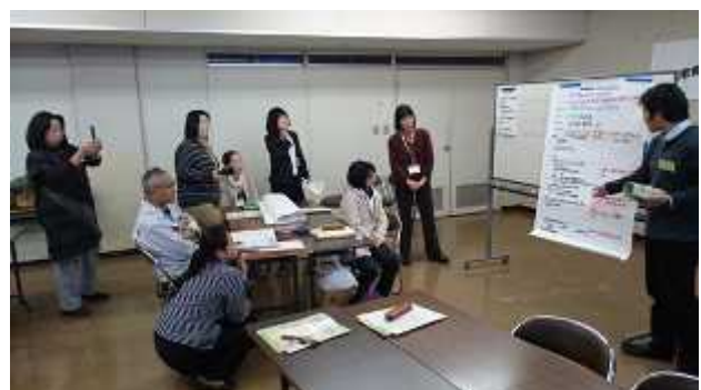
【第4回ガイドブックを活用した講座作り（上越会場）】