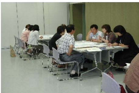
中越地区・刈羽村ラピカ会場のひとコマ。話が弾みます。

どの会場も170人前後の参加がありました。タイムリーで充実した内容は参加者の満足度の高い研修となりました。各校のPTA活動に生かされることを期待します。