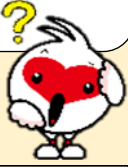
研修を受けられての感想

生涯学習基盤・地域づくりの拡充や推進のために必要な理論や実践を学び、社会教育関係職員等の資質向上を図ることをねらいとして行われている研修会です。