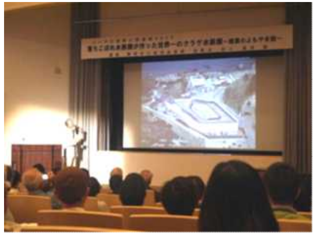
【ホールでの講演の様子】

主会場の県立生涯学習推進センターホール、ネットライブ配信会場の同施設大研修室・村上市生涯学習推進センター・新発田市生涯学習センター・刈羽村生涯学習センターラピカの会場を合わせ、171名の方から受講していただきました。受講者は高齢者だけでなく、10～40歳代の受講者が他の講座に比べて多かったこと、受講者の満足度(肯定的評価)が100%であったことは、成果です。