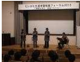
ぐるーぷ・赤い靴