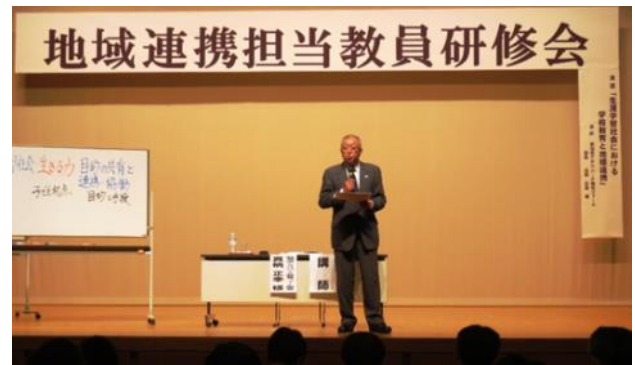
【真柄先生の講義の様子】

なお、「管理職等対象研修」には、当センターで行っている「地域連携コーディネーター養成スクール」の受講者も参加する日程としています。熟議する時間は設定してありませんが、立場の異なる方々で、これからの地域と学校の連携・協働のあり方を一緒に考えたいと思います。