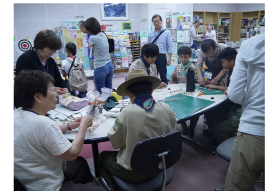
生涯学習相談ボランティアの活動の一場面 「生涯学習県民フォーラムで子どもたちの活動を支援」