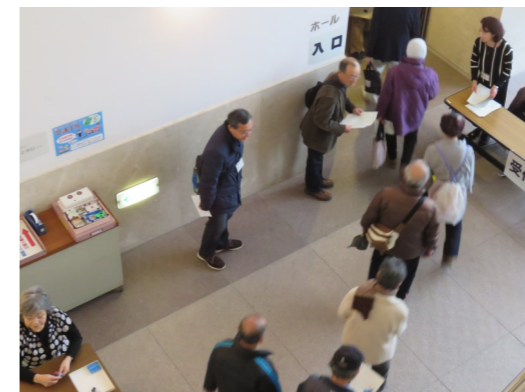
映画ボランティアの活動の一場面 「上映会の受付や整理券の配付」

当センターの「映画・ビデオ鑑賞会」と「上映会」には映画ボランティアさんが、「生涯学習相談コーナー」では生涯学習相談ボランティアさんが、活動しています。ボランティアを始める動機は様々ですが、いずれも「人の役に立つのなら…」という