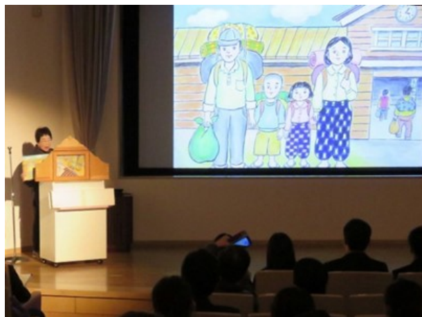
自作映像・視聴覚教材コンクール授賞式の様子