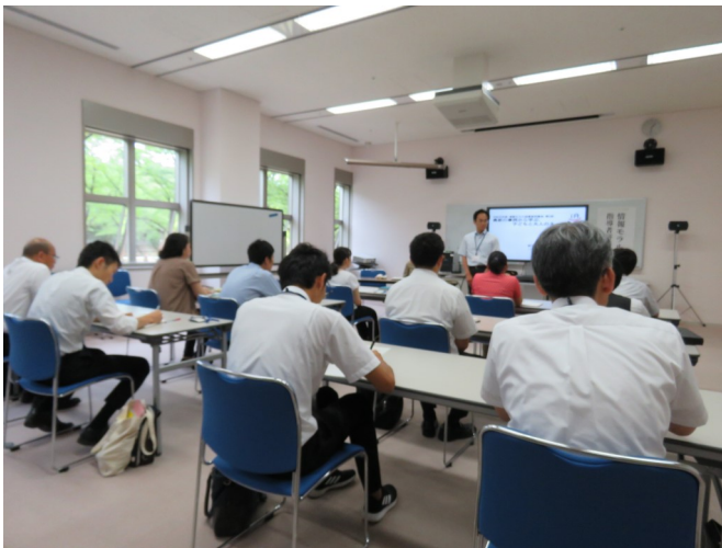
情報モラル指導者研修会の様子

2回目は、テーマを「授業・講座づくりに役立つ情報提供と実際」としました。具体的には、 提案授業とフィルタリング設定方法、授業・講座に活用できる資料検索やアプリ体験 を行いました。その後、参加者全員が「私の取組」として、情報モラル教育に関する各自の取組を計画しました。