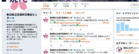
生涯学習推進センターのTwitter画面