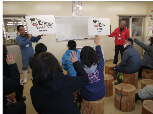
宿泊研修 搾乳体験の一場面

また、先進的で特色のある取組を行っている施設を見学する現地研修は、2月19日(水)に実施し、県の施策等の説明後、午前は新潟県立万代島美術館、午後は新潟市いくとびあ食花を訪問しました。それぞれの担当の方から、社会教育施設としての施設概要や運営方針、事業内容などを説明していただき、受講生の視野を広げる1日となりました。 当センターでは、来年度も令和3年1月21日(木)から2月18日(木)の期間で社会教育主事講習 [B] を実施する予定です。規定改正により期間が短くなりました。また、社会教育主事の資格修得とともに、社会教育士の称号も得ることができます。多くの方から受講いただきますようお願いいたします。興味のある方は、早めに当センターまでお問合せください。