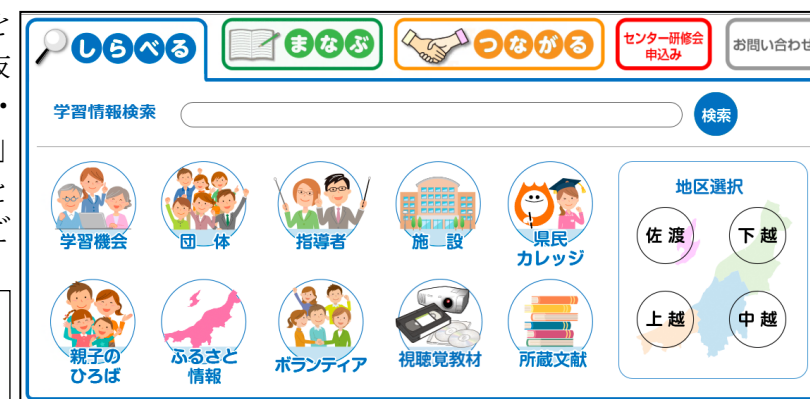
【トップページ「しらべる」機能】

ラ・ラ・ネットでは、「県内各地で行われているいきいき県民カレッジの講座」、「研修会の講師」、「視聴覚教材」など新潟の生涯学習に関する情報を提供しています。キーワードでの検索や、しぼりこみ機能で条件を指定した検索があり、目的の方法を抜粋して表示することができます。ラ・ラ・ネットトップページ「しらべる」機能のなかで、この情報を知りたいと思ったときは是非ラ・ラ・ネットをご利用ください。