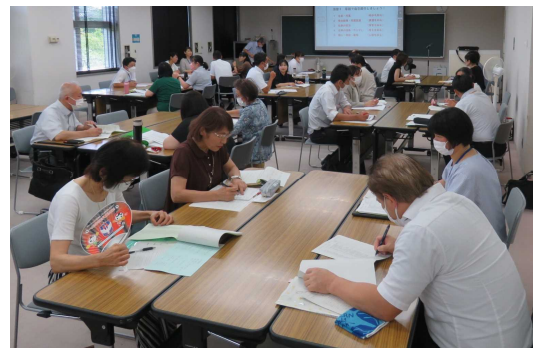
地域連携実践研修会の様子（令和5年7月20日）

さて、当センターでは、来年度の研修会開催に向けて計画づくりを行っています。今年度の研修会を振り返り、アンケート結果をもとに、研修内容や講師の選定、日程の調整を行っているところです。令和6年度は、生涯学習・社会教育関係職員、及び、関係団体職員の資質向上を図る研修会の実施を計画しております。経験年数に応じた研修体系の構築、センターへの参集が難しい小規模公民館職員等も参加しやすい実施方法など、これまでの研修会の内容、実施方法等の見直しを図っております。来年度の研修会につきましては、内容、日程等が確定次第、お知らせいたします。センター研修会のリニューアルにどうぞご期待ください。研修会後のアンケートにご協力いただきありがとうございました。