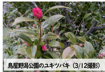
鳥屋野潟公園のユキツバキ (3/12撮影)

新潟県の木であるユキツバキは、雪解けを待って花を咲かせることから雪国に春を告げる花として知られています。鳥屋野潟公園のユキツバキは、今にも咲こうと蕾を膨らませていました。このユキツバキによく似た花に、ヤブツバキがあります。ヤブツバキは、冬の時期に開花し、葉の形、おしべの花糸の色などに違いが見られます。植物の観察から春の訪れを感じるのはいかがでしょうか。