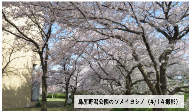
鳥屋野湯公園のソメイヨシノ（4/14撮影）