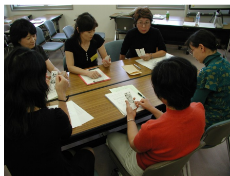
チームワークづくり “う～ん” どうつながる? (推進ゲームより)

今後の予定としては、3回目は事例研修として、山形県・やまがた育児サークルランドの有川富二子さんによるサークルのネットワークづくりの紹介と参加者同士の情報交換を行います。4・5回目は、(有)マックス・ゼンパフォースコンサルタント代表取締役の丸山結香さんによる「コーチング」を取り入れた演習を通じて学習を深めていく予定です。