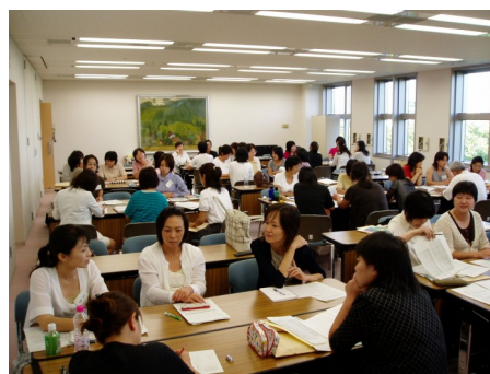
グループで活発に意見交換

昨年度までの家庭教育サポーター養成研修会の修了者は271名になります。今後も各市区町村での活動が、ますます必要とされていくことと思います。