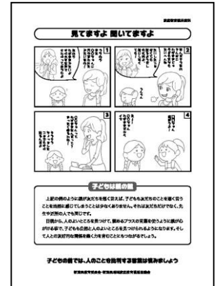
【ワークシート、資料の例】